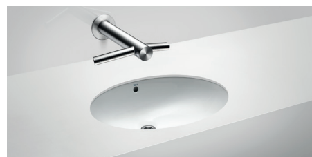
Roca Berna vitreous china basin 327871001

Unter der Arbeitsplatte montiert Außenmaße B x T 560 mm x 420 mm