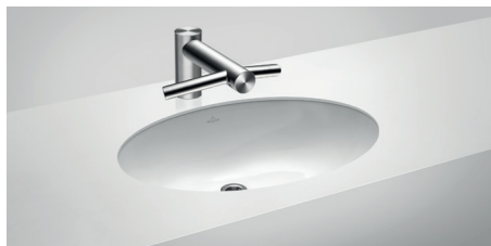
Villeroy & Boch Evana 614400

Unter der Arbeitsplatte montiert Außenmaße B x T 615 mm x 415 mm