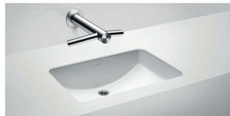
Kohler Ladena 2215

Unter der Arbeitsplatte montiert Außenmaße B x T 591 mm x 413 mm (23-1/4" x 16-1/4")