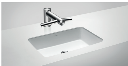
Villeroy & Boch Architectura 417760

Unter der Arbeitsplatte montiert Außenmaße B x T 540 mm x 340 mm