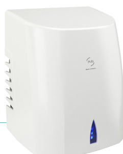
REF 8 11 1167 Copt'air automatique alu blanc UL 1 : 4

+ REF 5 30 1899 Filtre anti-bactérien UL 1 : 1