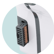
HYGIÉNIQUE FILTRE CUIVRE BACTÉRICIDE ET RÉSERVOIR D'EAU INTÉGRÉS, TRAITEMENT ANTIBACTÉRIEN DES SURFACES

+ REF 5 90 2014 Filtre cuivre Bactéricide UL 1 : 1