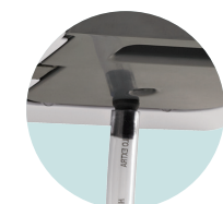
ÉVACUATION DIRECTE RACCORDEMENT AU TOUT A L'ÉGOUT POSSIBLE GRACE AU KIT ÉVACUATEUR INCLUS